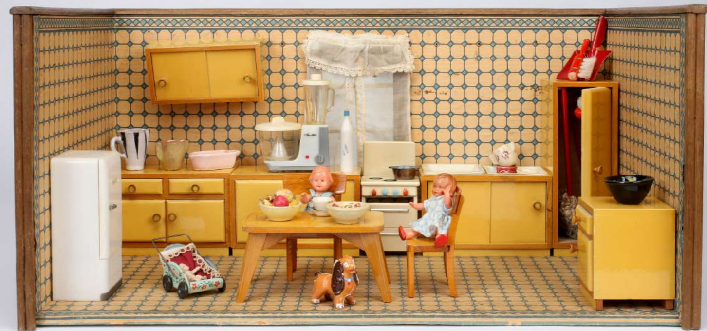
Puppenküche: Gehäuse, vor 1950, 26 x 54 x 30 cm; Einrichtung, Ende 1950er-Jahre – Slg. Ott