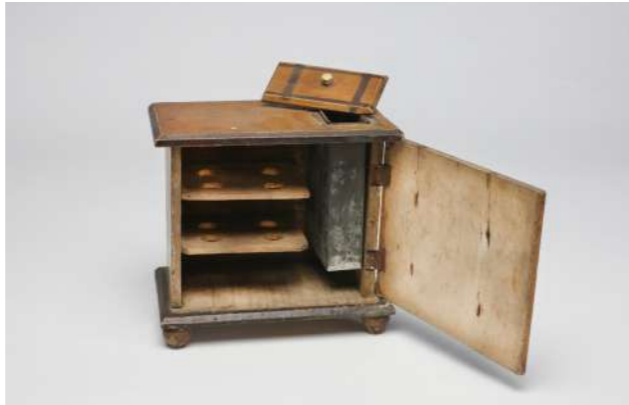
Eisschrank für Flaschenkühlung, um 1900

Blechherde für die Puppenküche tauchten etwa gleichzeitig mit der Verbreitung der geschlossenen, neuartigen Herde in den bürgerlichen Haushalten auf (Abb. S. 66). Dank kleiner Spirituskocher konnte auf ihnen