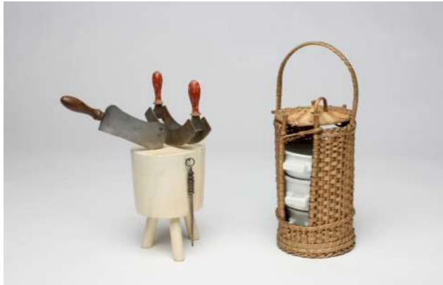
Hackklotz mit Hackmesser, Wiegemesser und Wetzstahl, Essens-träger, um 1900 – Slg. Ott

Haushalte ein. Strom als Energie zum Kochen fand in dieser Zeit nur in die Küchen der Begüterten Eingang, da er sehr teuer war. Erst zwischen den Weltkriegen erfolgte allmählich die allgemeine Umstellung auf Gas und Elektrizität, was wiederum eine enorme Erleichterung der Küchenarbeit bedeutete. Man denke nur an das mühevoll Herbeischaffen von Kohle oder Holz.