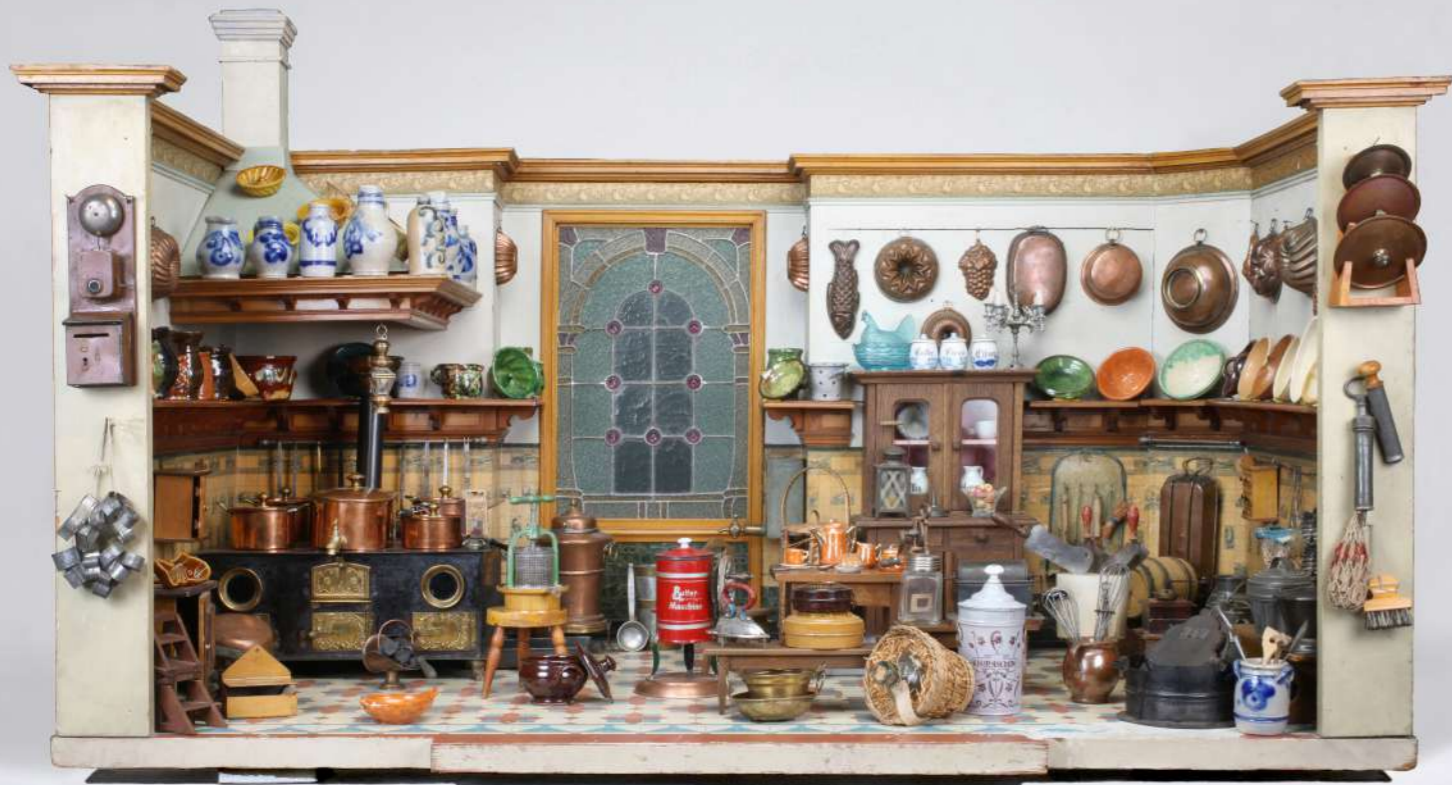
Puppenküche, um 1890 – um 1910, 85 x 134 x 92 cm, Tapete von Villeroy & Boch sowie Herd, Kaffeemühle, Brotkapsel, Saftpresse, Butter- und Eismaschine von Märklin, Göppingen, Telefon von Gebr. Bing, Nürnberg – Slg. Ott