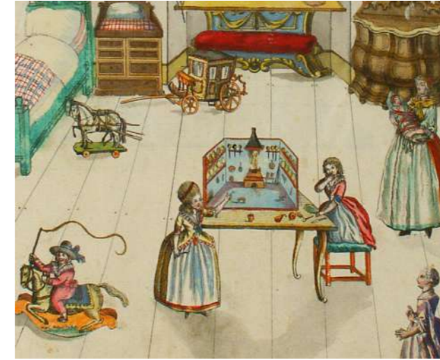
Kinderzimmer mit Mädchen beim Spiel mit einer Puppenküche, Ende 18. Jahrhundert, koloriertes Ausschneidebuch (Ausschnitt) – Bayerisches Nationalmuseum München

Sowohl der Adel als auch das Großbürgertum leisteten