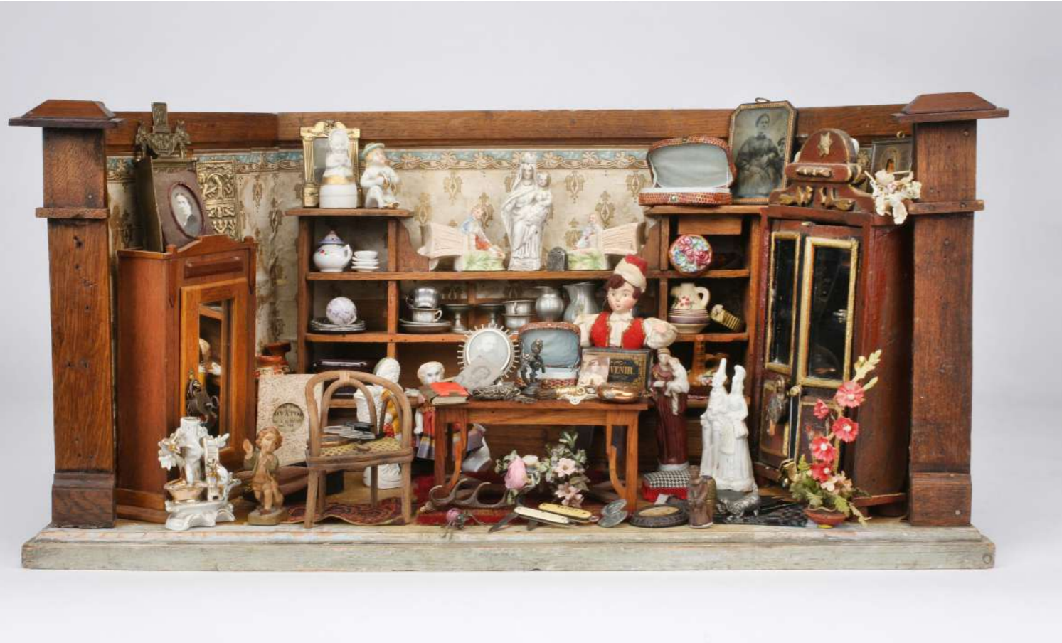
Antiquitätenladen, um 1900, 29 x 59 x 24 cm – Slg. Ott