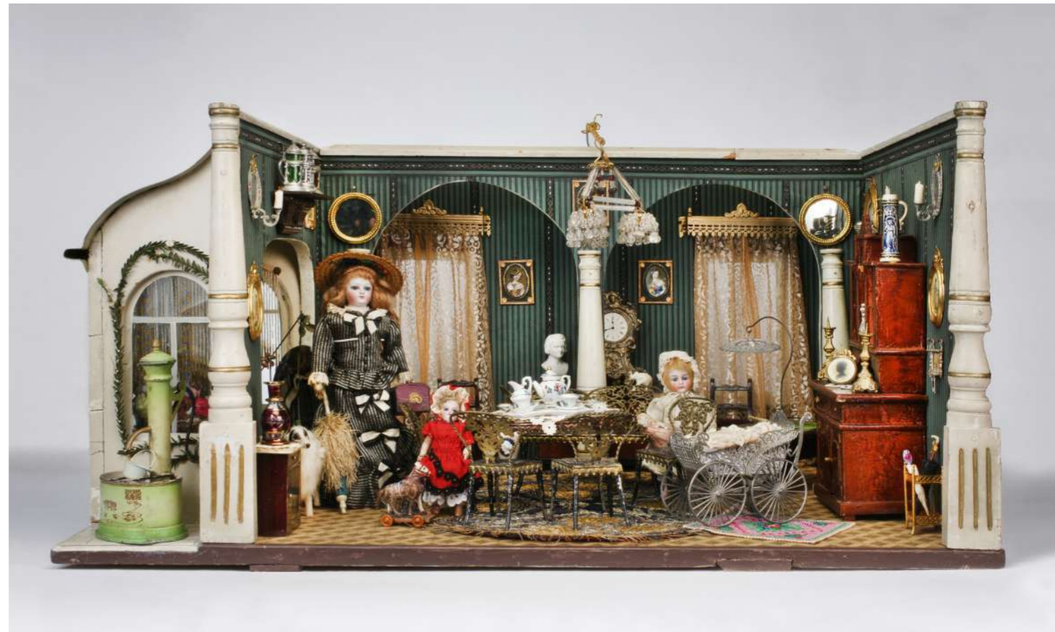
Puppenstube mit Korridor und Veranda, um 1890, 44 x 66 x 55 cm, Tisch und Sitzgarnitur vermutlich von Märklin, Göppingen – Slg. Ott