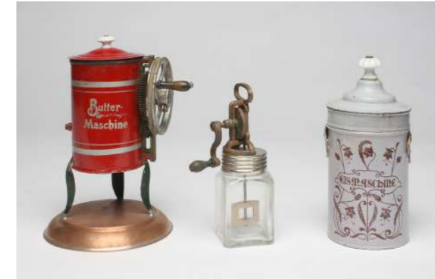
Buttermaschine von Märklin, Göppingen, um 1900; Butterrührglas, um 1900; Eismaschine von Märklin, Göppingen, um 1910 – Slg. Ott

Die Ausstattung der großen Küchen und deren kleiner Nachahmungen wurde seit den Gründerjahren in Folge