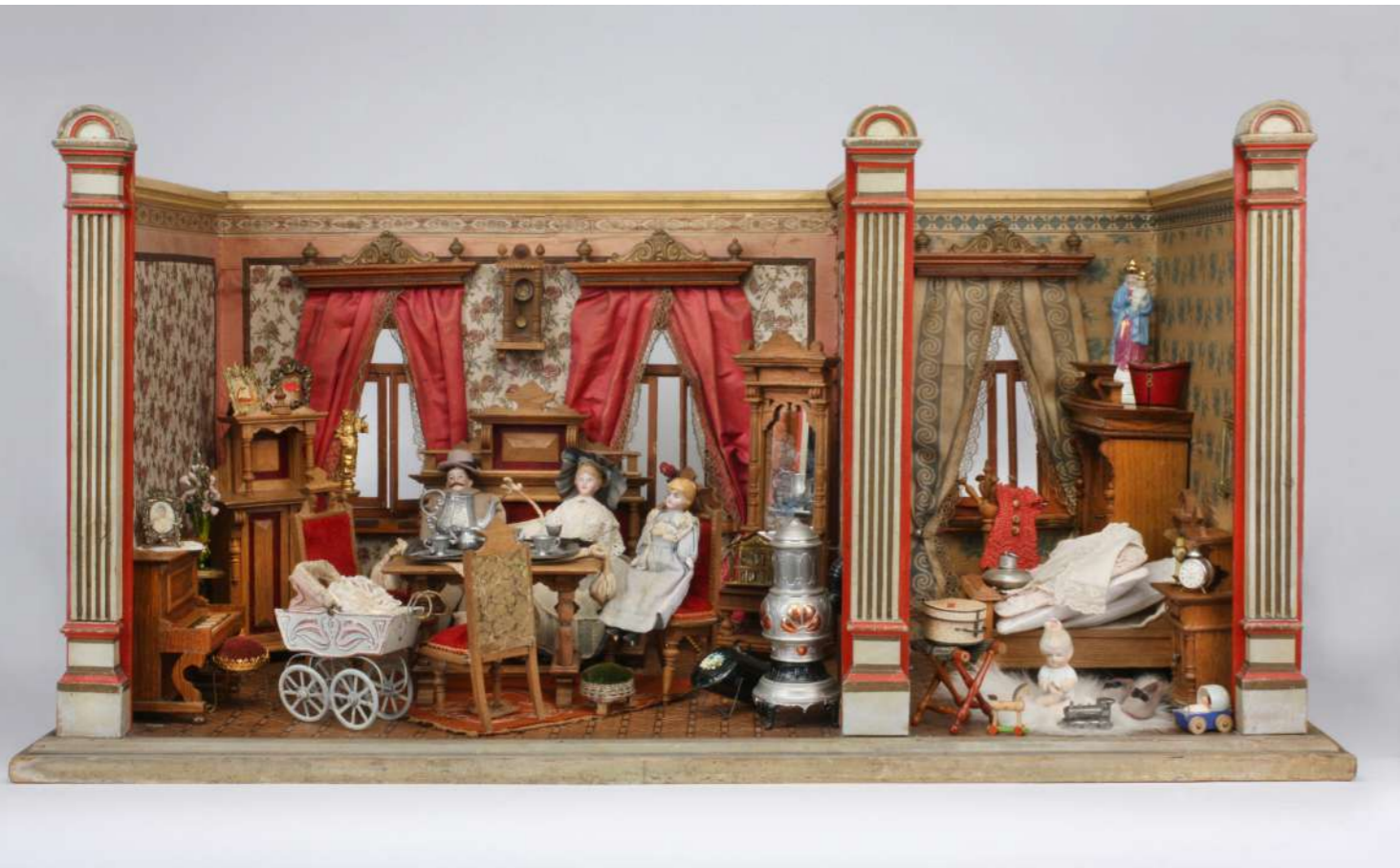
Puppenstube, um 1890, 44 x 89 x 41 cm, Gehäuse von Moritz Gottschalk, Marienberg – Slg. Ott