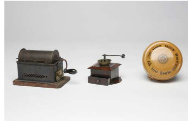
Kaffeeröster mit heizbarer Drehtrommel, um 1900; Kaffeemühle und Brotkapsel von Märklin, Göppingen, um 1900 – Slg. Ott

Rauchfangküchen blieben trotzdem noch lange in den Kinderzimmern, denn der Austausch des Herdes machte nicht unbedingt die Anschaffung eines neuen Gehäuses nötig. Es wurden sogar noch im ausgehenden 19. Jahrhundert Küchengehäuse mit Rauchfang gefertigt