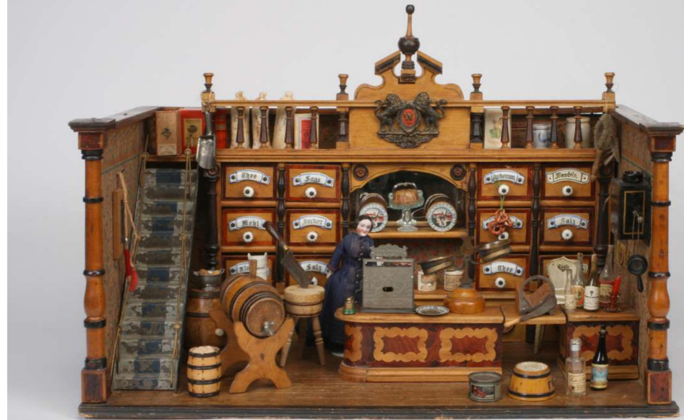
Gemischtwarenladen, um 1900, 42 x 61 x 35 cm – Slg. Ott