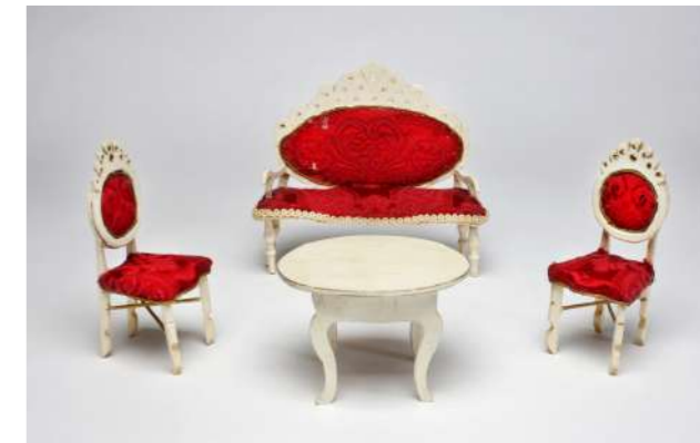
Sitzgarnitur mit Tisch, Anfang 20. Jahrhundert – Sig. Ott

Bis ins 20. Jahrhundert war es möglich, Haushaltsgegenstände für die Ausstattung auf dem Markt zu erwerben, wo Handwerkerzeugnisse in Normalgröße für die Erwachsenenwelt angeboten wurden, denn die Materialien, aus denen viele der Miniaturausgaben des Hausrates gearbeitet waren, glichen denjenigen, aus denen die entsprechenden Waren in Groß hergestellt wurden. Einen solchen Einkauf schilderte Ina Bindschedler, eine Schweizer Autorin, in dem Kapitel »Wie es auf dem