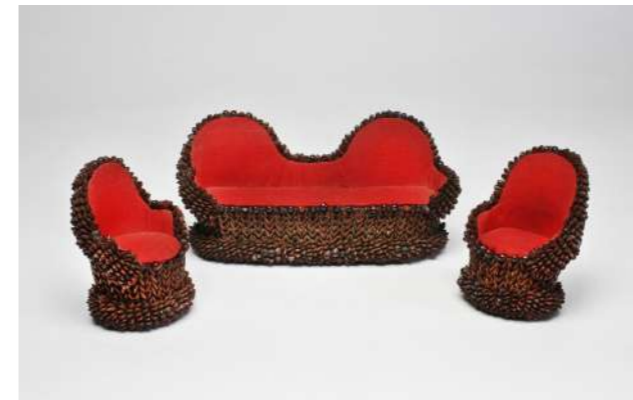
Sitzgruppe aus Apfelkernen – Sig. Ott

Auf Wunsch konnte die Gestaltung sehr aufwendig ausfallen. In einer Puppenstube aus der Sammlung Ott äußert sich dies in der verglasten Veranda sowie in den die Arkaden im Innern und die Stirnseiten der Gehäuseseitenwände schmückenden Halbsäulen (Abb. S. 19), wie sie neben Dreiviertelsäulen und Pilastern in den zeitgleichen Gehäusen der Spielzeugmanufakturen üblich waren. Eine weitere Schreinerarbeit besticht nicht nur