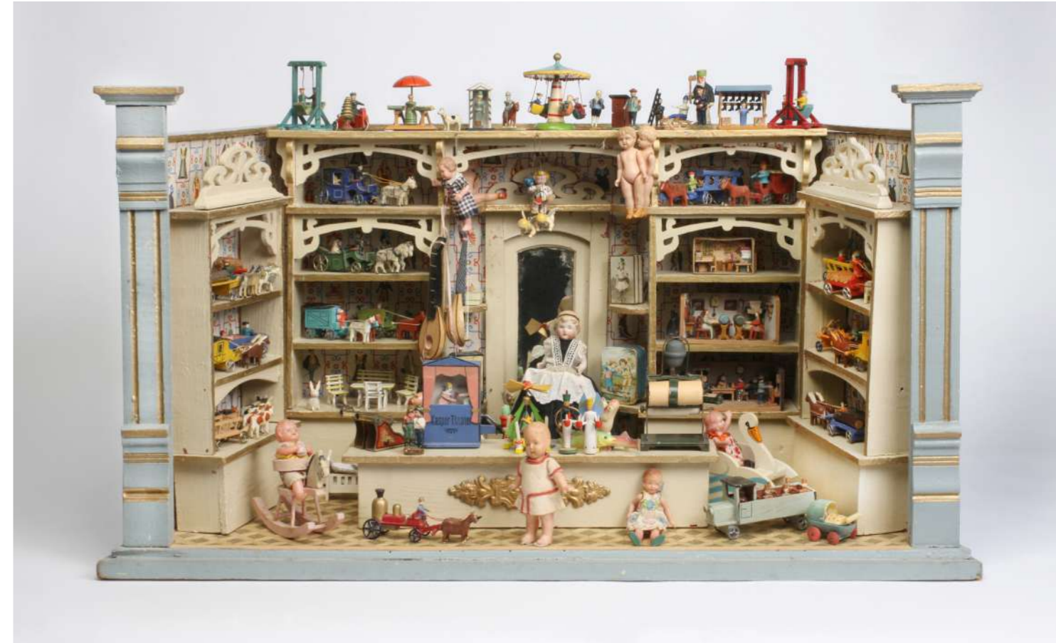
Spielzeugladen, um 1910, 42 x 73 x 32 cm – Slg. Ott